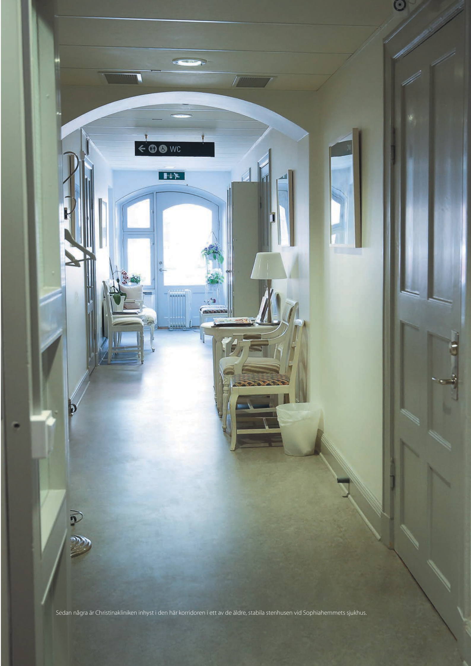
Sedan några är Christinakliniken inhyst i den här korridoren i ett av de äldre, stabila stenhusen vid Sophiahemmetts sjukhus.